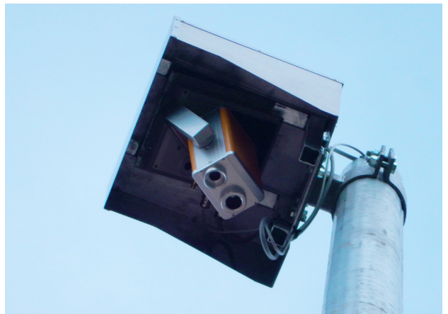
Das Pyrosmart-System ist auf einem 35m hohen Mast im Top-Down Wetterschutzgehäuse installiert. Damit ist eine optimale Sicht auf die Detektionsfläche gewährleistet.