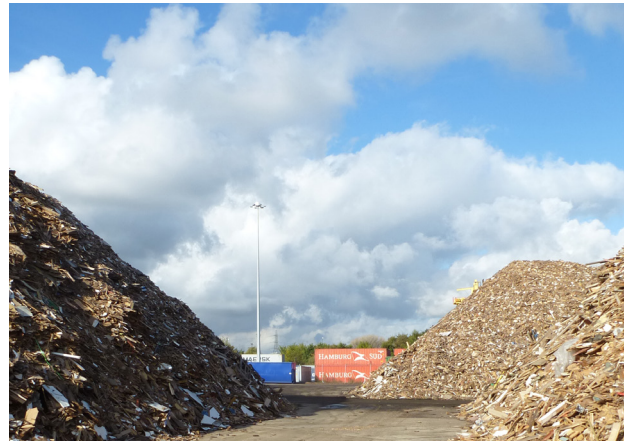
Ein Außenlager mit Ersatzbrennstoff aus Holzrecycling-Material birgt eine hohe Brandgefahr.

In der Niederlassung von Hadfield in Middlesbrough sind insgesamt fünf Pyrosmart-Systeme im Einsatz, die die Lagerplätze, die eine Fläche von mehreren Fußballfeldern haben, rund um die Uhr überwachen und so für einen wirkungsvollen Schutz sorgen. Installiert wurde das System von der Firma Helios Systems Ltd, Manchester, die für Großbritannien exklusiv als Pyrosmart-Vertriebspartner tätig ist.